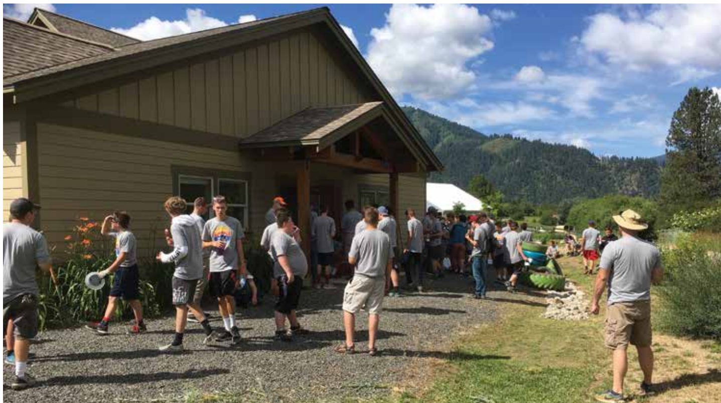
Regelmatig komen vrijwilligers zich spontaan aanbieden om iets te doen voor ons, hier vrijwilligers van een van de vele mormonenkerken uit onze omgeving.

Nee, ik vind het heerlijk hier. Ik kijk met veel plezier terug op mijn bibliotheekjaren in Nederland, maar ik zie hier nog zo veel leuke uitdagingen, dat ik hoop dat we hier nog lang mogen blijven wonen en werken. Ik bedoel maar: in welke bibliotheek praat je dagelijks met mensen die geloven in elke complottheorie die er maar te bedenken valt? In welke bibliotheek vind je mensen die oprecht geloven dat ofwel de zombies in aantocht zijn of anders toch wel buitenaardse wezens? In welke bibliotheek moet je extra vrijwilligerswerk verzinnen omdat een groep van veertig gemeenteleden van een mormonenkerk uit de stad bedacht heeft bij jou vrijwilligerswerk te komen doen? In welke bibliotheek word je elk jaar door de school uitgenodigd als 'community hero' en krijg je dezelfde status als de brandweer en politie? In welke bibliotheek moet je koeien uit de tuin jagen? (Wij hebben een speciale kindertuin en een leestuin.) En