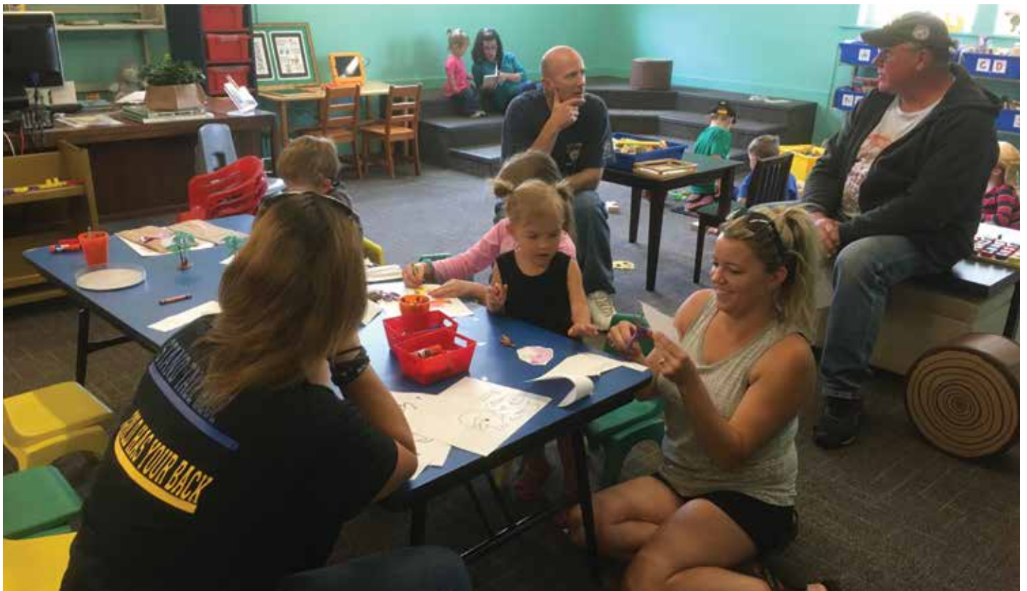
StoryTime is niet alleen belangrijk voor de kinderen, maar ook voor de ouders en verzorgers – een belangrijk moment om elkaar te ontmoeten.

Wij dachten echt dat er in Nederland duidelijker richtlijnen waren dan hier in Idaho. We waren dan ook oprecht verbaasd toen we hoorden dat in Nederland niemand in een supermarkt een mondmasker draagt. Ook al kent iedere county (gemeente) hier haar eigen coronamaatregelen, het dragen van een mondmasker in een supermarkt is hier een vanzelfsprekendheid. Zonder kom je niet in een winkel. Nou ja, behalve dan in ons dorp. Daar komen meer mensen zonder mondmasker dan met, en dat heeft er alles mee te maken met dat hier de meerderheid een 'Trumpie' is, een republikein, en in de stad is het merendeel democraat. In onze bibliotheek is het verplicht een mondmasker te dragen. Rondom de inlever- en uitleenbalie hebben we een plastic scherm gehangen en alle materialen gaan 72 uur in quarantaine. Al het speelgoed is weggeborgen en de activiteiten staan 'on hold'. Ouders die het niet leuk vinden dat ik geen StoryTime meer doe, reizen anderhalf uur verder naar de bibliotheek van Stanley, waar ze het wel doen. Kregen we in het begin nog wel eens veel klachten van leden die van ons verplicht een mondmasker moesten dragen, inmiddels lijkt dit een stuk gemoedelijker te gaan. Misschien doordat ze zagen dat wij het serieus meenden: er is een klant de bibliotheek uitgezet vanwege het weigeren van het dragen van een mondmasker. De sheriff (wij hebben in onze county een sheriff en twee deputies op een gebied net zo groot als Gelderland) moest ervoor langs komen. En dat heeft wel indruk gemaakt.