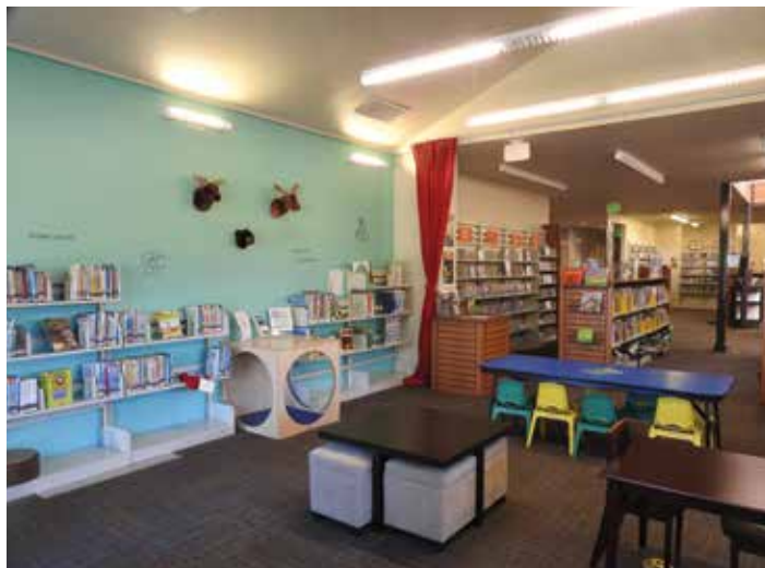
De jeugdafdeling – normaal ligt het hier ook vol met speelgoed, maar in verband met corona is dit weggehaald.