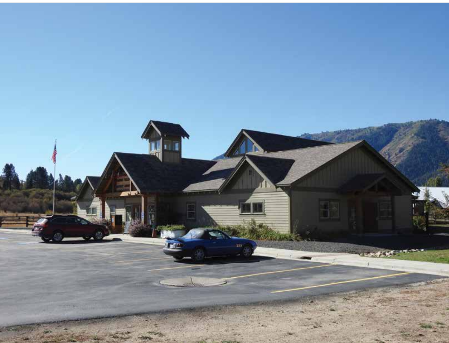
De Garden Valley District Library ligt in een prachtig bergachtig gebied in de staat Idaho. Deze staat grenst in het noorden aan Canada, in het westen aan de staten Washington en Oregon, in het oosten aan Montana en Wyoming en in het zuiden aan Nevada en Utah.

nog zo'n titel. Ik ben al veel voorgesteld aan mensen die 'wereldberoemd' zouden zijn. Als je ze dan opzoekt op google, zijn ze vooral wereldberoemd in hun eigen stad of dorp, maar verder zijn het onbekende Amerikanen. In de hoofdstad van Idaho, Boise (spreek uit: Boizie), is een bar 'De Ranch Club' die claimt wereldberoemd te zijn. Maar wie ik ook vraag, niemand heeft er ooit van gehoord. Nee, Amerikanen denken misschien dat zij het voorbeeld voor de rest van de wereld zijn, de werkelijkheid is dat ze hier decennia achterlopen. Mijn salaris krijg ik bijvoorbeeld nog lekker ouderwets via een loonstrookje. Een auto overschrijven gaat hier niet via een app, maar je moet ervoor naar de DMV (vergelijkbaar met RDW) en daar kun je gerust een dag vrij voor nemen van je werk (niet alleen is het meer dan een uur rijden bij ons vandaan, de gemiddelde wachttijd is er ook nog eens drie uur). En zo zijn er tal van voorbeelden waarbij wij steeds maar weer denken: dat meen je niet, dat is zo achterhaald!