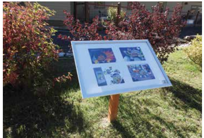
Buiten staan achttien borden waarop pagina's van een boek kunnen worden getoond – dit is de StoryWalk – kinderen moeten bewegen om zo het verhaal te kunnen lezen.