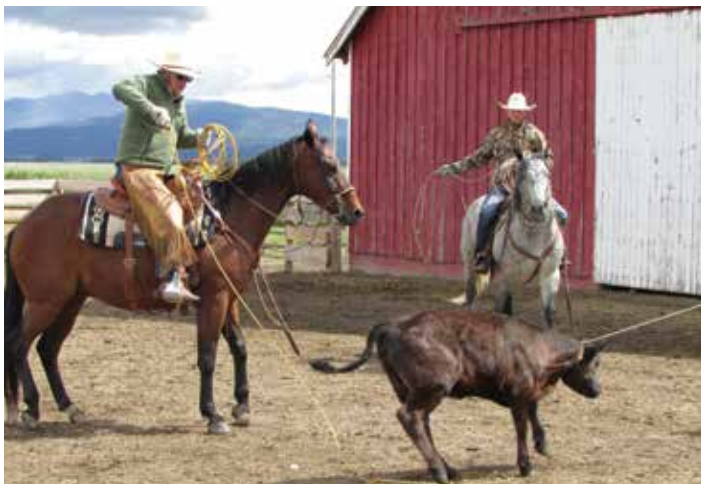
Een collega heeft ook een ranch, en zij neemt me vaak mee als alle cowboys komen om op hun ranch aan de slag te gaan.