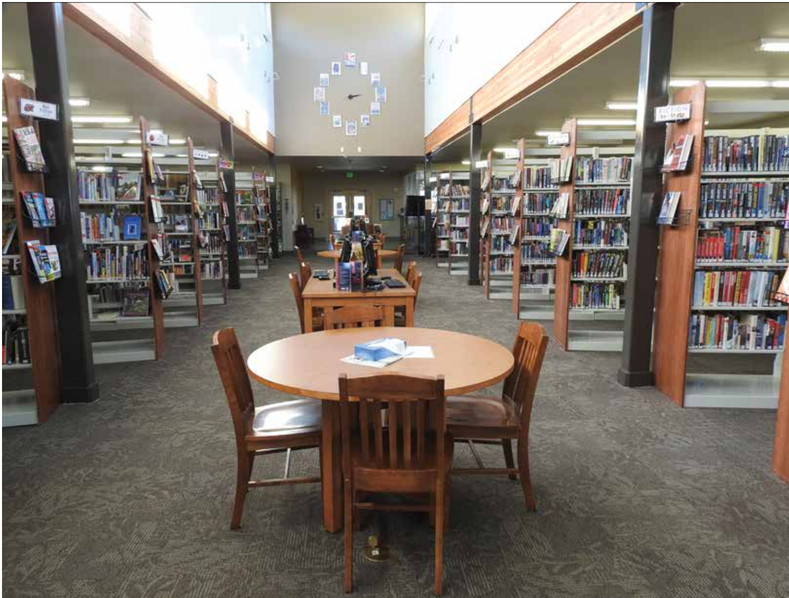
De leeszaal van Garden Valley District Library.