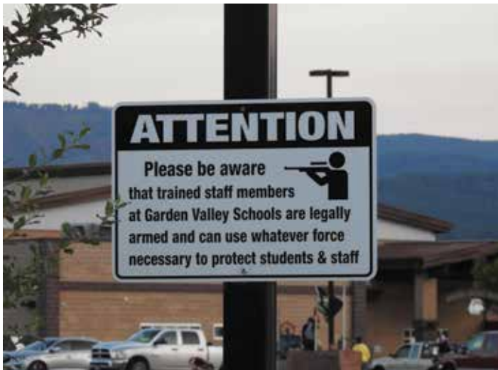
De school staat nationaal bekend om het strikte second amendment protocol . Ook leerlingen kunnen hier schietles krijgen.