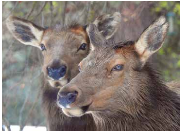
Deze foto heb ik in onze tuin genomen – twee elanden, elkdames.