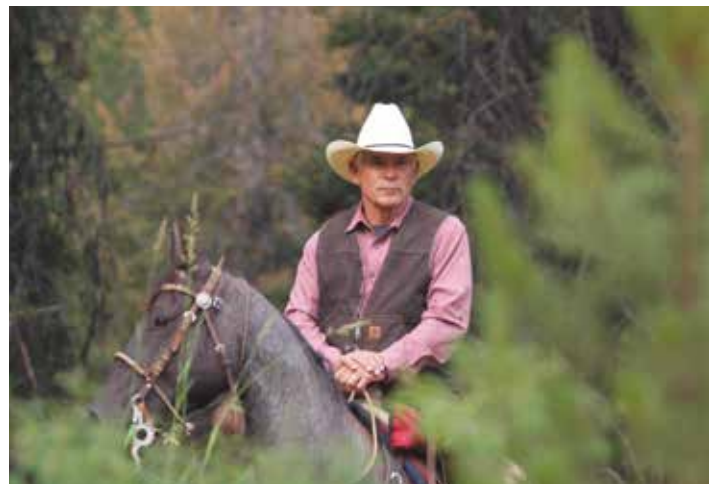
Idaho is nog echt het wilde westen, en cowboys kun je hier bijna dagelijks tegenkomen.