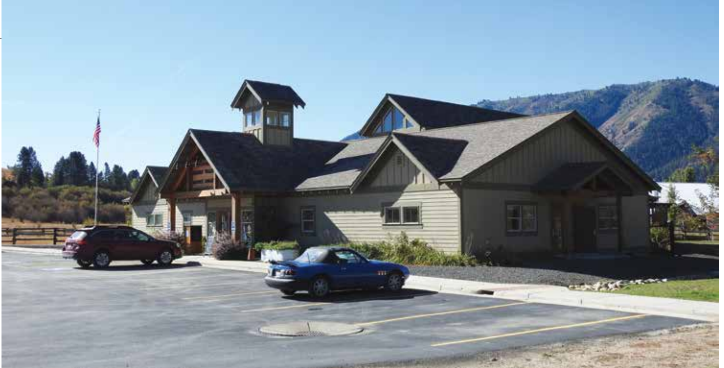
Het gebouw van Garden Valley District Library.