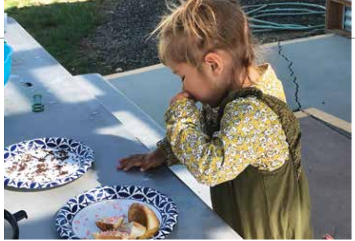
Tijdens StoryTime deze zomer heb ik gezorgd voor echte Nederlandse broodjes met hagelstag.

Ook het contact met de lokale school gaat een stukje beter. Heel lang was er nauwelijks contact met de school, op de jaarlijkse Community Helpers Day na. Toen ik bij deze bibliotheek ging werken, kreeg ik al gauw te horen dat de directrice van de school onze bibliotheek niet fijn vindt. Ik heb haar nooit ontmoet (ze is inmiddels naar elders vertrokken) en ik heb me er nooit iets van aangetrokken. Ik liet regelmatig mijn gezicht zien op de school en ik verweende de schoolbibliothecaris regelmatig met boeken die ik beter voor de school vond. Toen mijn 3D printer kapot ging, nam ik contact op met de leerkracht techniek, die hem samen met enkele studenten repareerde. Als bedankje bracht ik hem onze collectie 3D printerpenningen, die hij een tijdje met zijn studenten kon gebruiken. Terwijl ik met vakantie was dit jaar, kreeg ik een sms'je van mijn bazin: niet schrikken, als je terugkomt heb je twee dagen en dan komen er veertig kinderen met leerkrachten en ouders. En ze willen 'iets' met