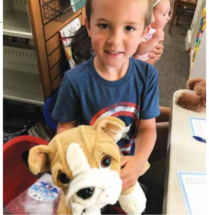
Tijdens StoryTime Special Summer Reading mochten kinderen zelf een knuffelbeest maken.

En dan is er nog de schaduw die over ons hangt van politieke groeperingen die steeds vaker hun boosheid richten op de bibliotheken. In Missouri proberen ze een wet erdoor te krijgen waarbij het censureren van boeken in openbare bibliotheken gelegaliseerd wordt. Als een bibliotheek betraapt wordt op het uitlenen van boeken met voor de leeftijd ongepaste seksuele content, dan kan de bibliothecaris een gevangenisstraf krijgen van maximaal een jaar. Volgens de Republikeinse Partij zouden er panels moeten komen, samengesteld uit (Republikeinse) ouders die moeten gaan evalueren of een boek de kast in mag of niet. Als voorbeeld worden door de Republikeinse senator Ben Baker de boeken genoemd: The Absolutely True Diary of a Part-Time Indian (vertaald als 'Dagboek van een halve indiaan') van Sherman Alexie, en Slaughterhouse-Five (vertaald als Slachthuis vijf) van Kurt Vonnegut. En ook in de staat Wyoming gaat het