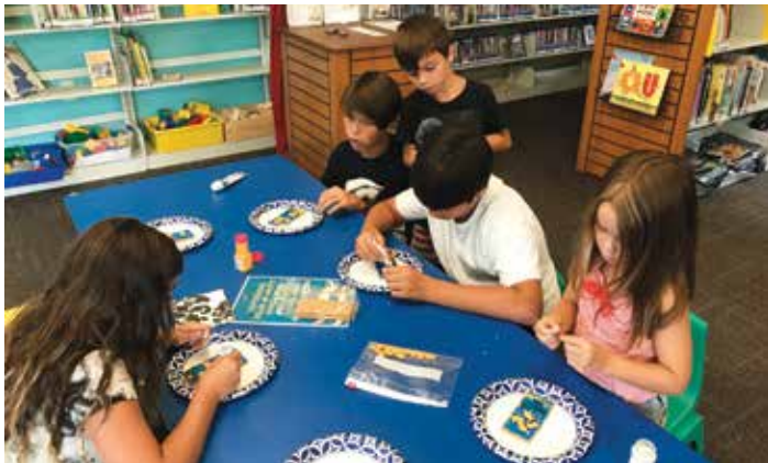
Tijdens Summer Reading (equivalent van de Nederlandse Kinderboekenweek) hebben we elke dag een activiteit gedaan. Op de foto het maken van een 'eetbaar aquarium'.