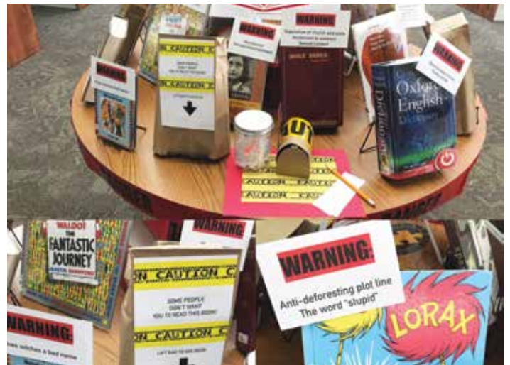
Banned Books Week is een jaarlijks evenement dat de vrijheid om te lezen viert. Het wordt meestal gehouden in de laatste week van september en belicht huidige en historische pogingen om boeken in bibliotheken en scholen te censureren. Een probleem waar wij voortdurend mee te maken hebben.