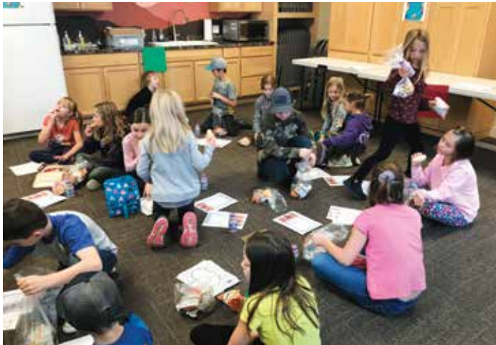
Na afloop van een groepsbezoek bleef deze klas nog even in de bieb. De school zorgde voor een lunch.