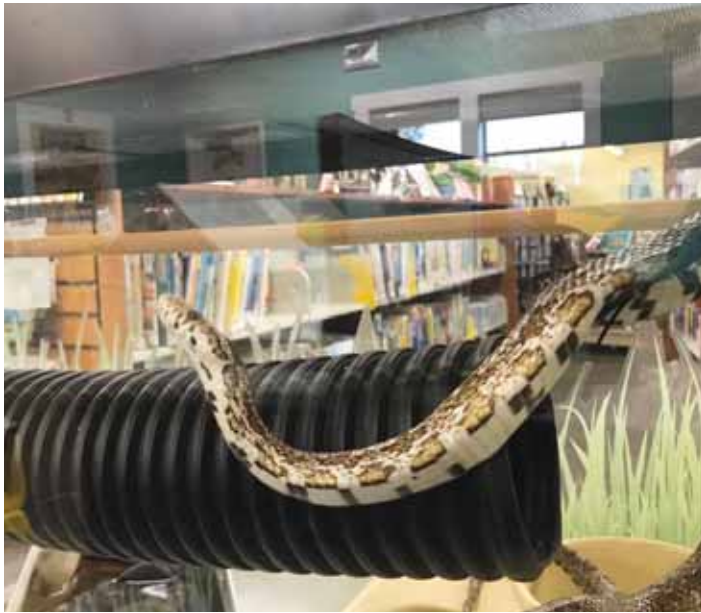
Mijn uitzicht vanaf mijn bureau. Jules de bibliotheekslang komt me elke dag even begroeten.