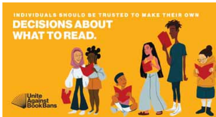
Een poster die ik aan mijn bureau heb gehangen.