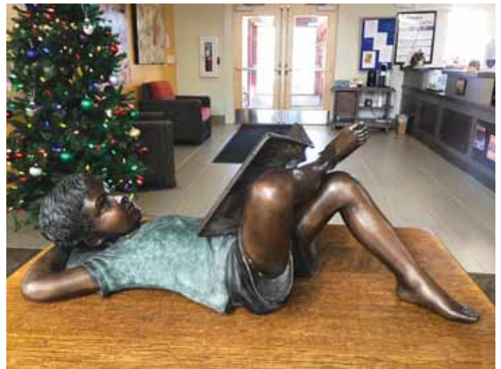
Dit beeld werd onlangs gedoneerd aan onze bibliotheek.

Roadhouse. Zeg vooral dat je jarig bent, en een heel team uit de bediening komt bij je tafel, schreeuwt tegen iedereen in het restaurant dat je jarig bent en op 1.2.3. schreeuwt iedereen in het restaurant Yiiiiieehhaaaa. Vervolgens wordt een zadel op wiel-tjes naar je tafeltje gereden en mag je even in het zadel zitten. En dat doet de jarige dan in negen van de tien gevallen.