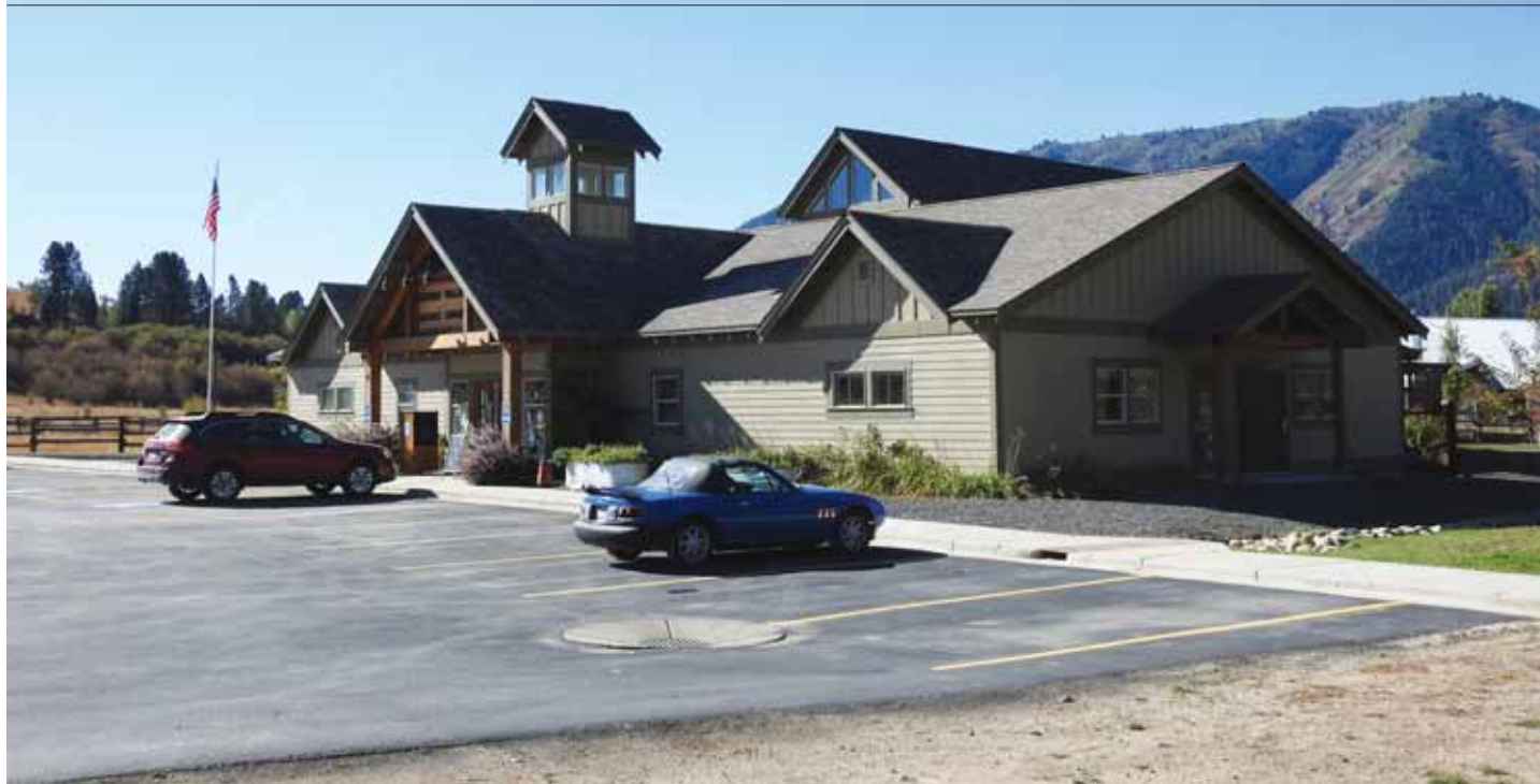
De Garden Valley District Library in Idaho.

en dochter elkaar vertellen, ik wil betrokken zijn bij de les, bepalen wat andere kinderen mijn zoon en dochter vertellen. Ik wil de volledige controle hebben. Daarom geef ik nu thuisonderwijs.'