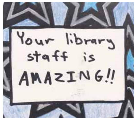
Ansichtkaart van de vrienden van de Secret Society of Library Friends.