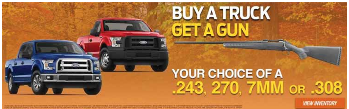
Je zou bijna denken dat het om een 1 aprilgrap gaat, maar helaas, het is bloedserius.

Niet lang daarna kregen we een e-mail van mijn bazin dat