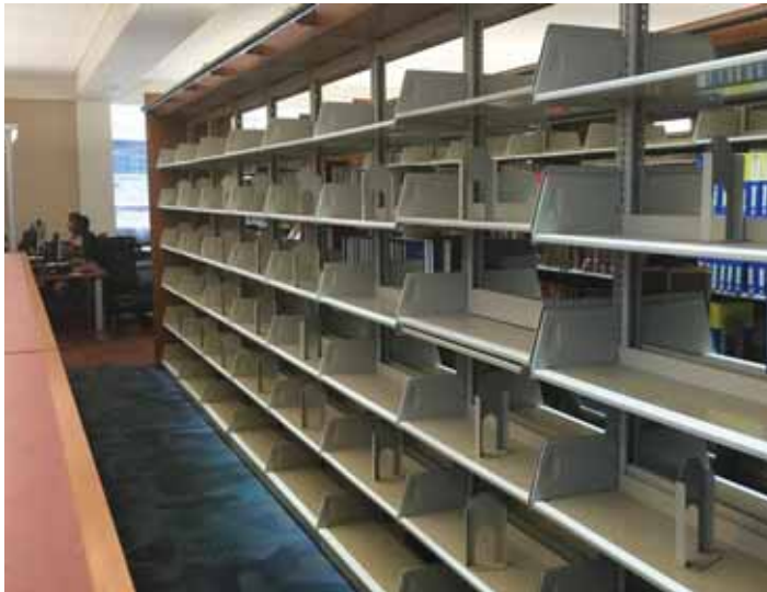
Lege boekenplanken in een gecensureerde schoolbibliotheek in Florida.